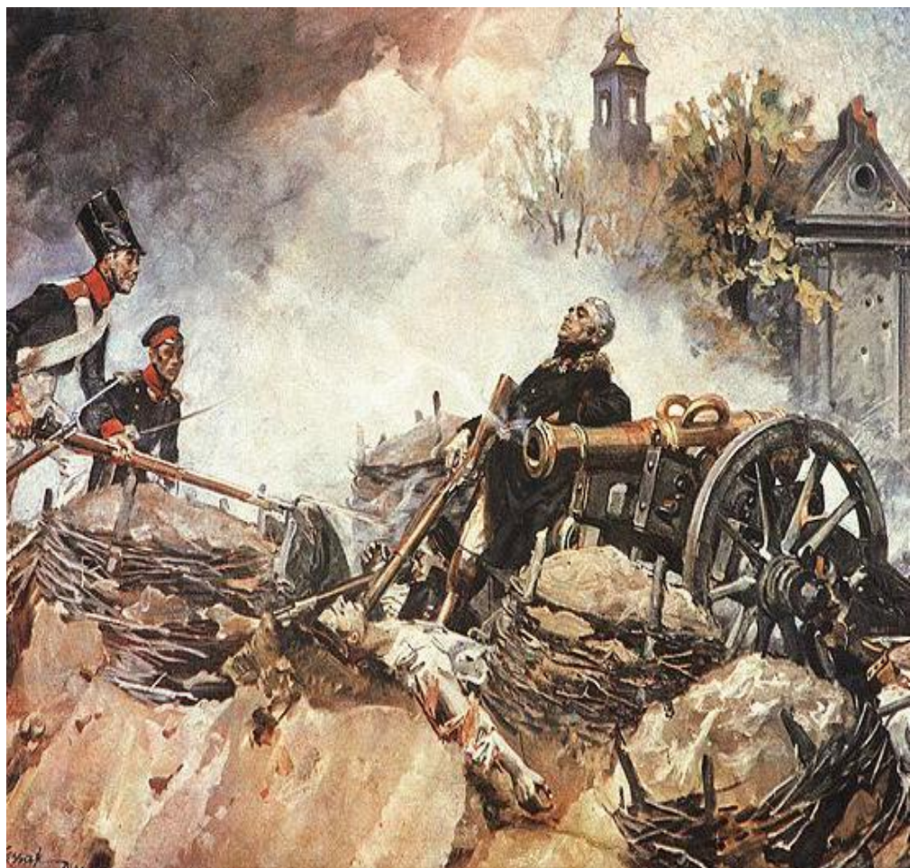
Wojciech Kossak, Sowinski na Woli