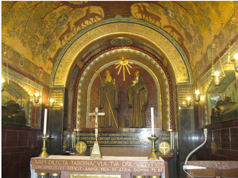
Kaplica w klasztorze na Monte Cassino, gdzie spoczywają święci. Benedykt i Scholastyka